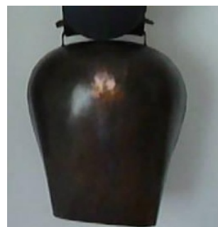
Abbildung 20: Chlopfe

Seit 1972 erhalten alle Teilnehmer einen Erinnerungspreis, meistens aus Holz, der als Sammelobjekt beliebt ist. Diese Preise werden von regionalen Betrieben gemäss Auftrag hergestellt. Es sind Objekte in Miniaturausführung, wie die folgende Aufstellung der bisherigen Andenken dokumentiert (zu