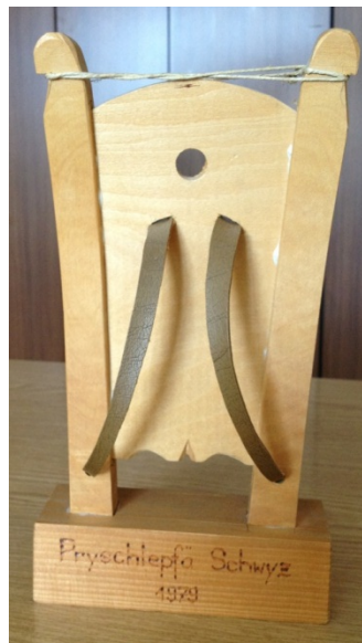
Tragräf (Rückengestell zum Tragen von Waren)