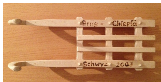
Horämäner (Holzschlitten für den Transport von Heu, Stroh usw.)