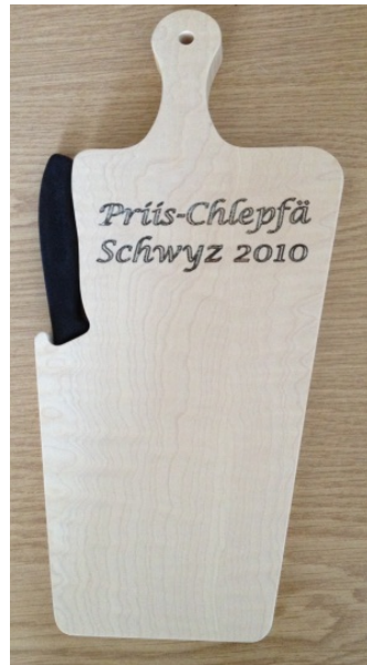
Chäsbrättli mit Mässer