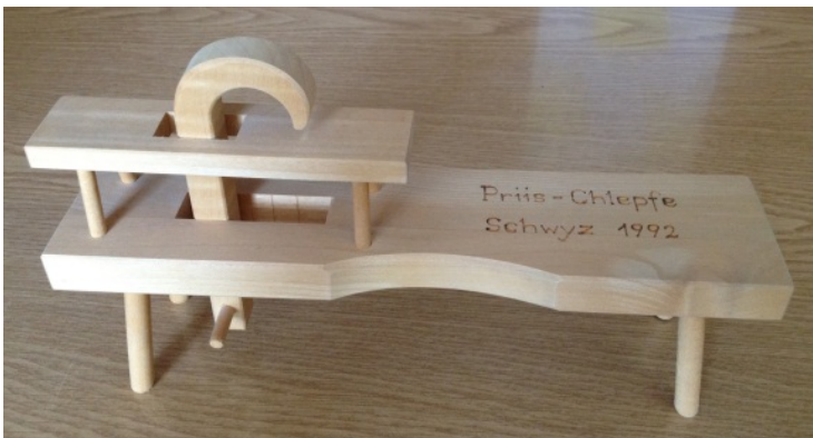
Schnätzesel (zum Spitzen von Holzpfählen usw.)