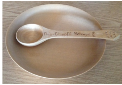
Suppätäller mit Löffel