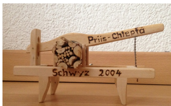
Abbildung 22: Studäbock (Arbeitsgerät zur Herstellung von Stauden)

Zusätzlich werden die treuen Chlepfer bei der 25. Teilnahme mit einer grossen Tafel Schokolade der Firma Max Felchlin, bei der 40. Teilnahme mit einer Erinnerungstafel samt Wein beschenkt und geehrt.