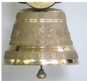
Abbildung 19: Schelle