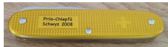
Sackmässer mid langär Ahlä