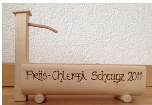
Abbildung 21: Brunnätrog