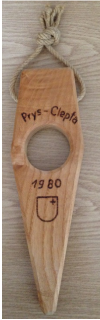
Trüegel (Heuseilbestandteil, zum Fixieren des angezogenen Seils)