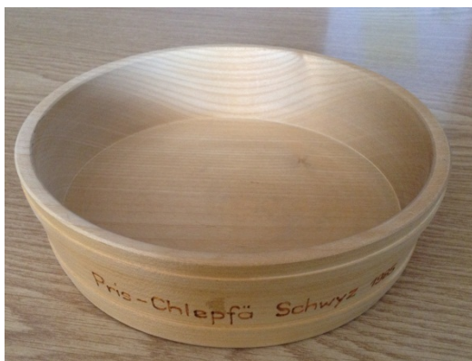
Muttli (Lagergefäss für Milch)