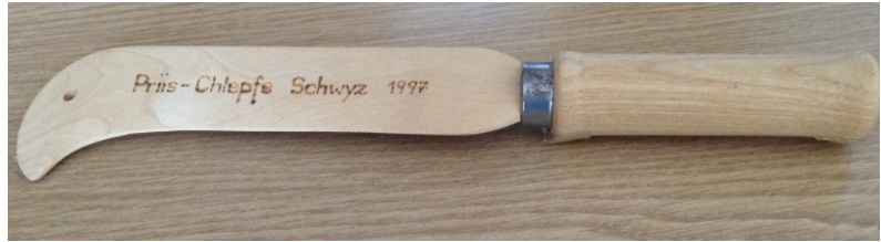
Gertel (Forstwerkzeug zu Abasten von Hand)