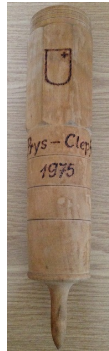
Wetzsteifass (Wetzsteinschaft für den Wetzstein des Handmähers)