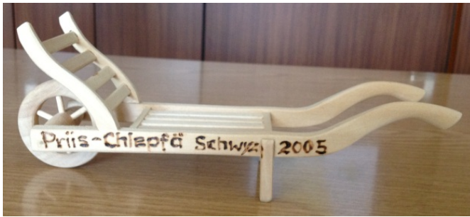
Steibärri (Schubkarren zum Transportieren von Steinen, Holzpfählen usw.)