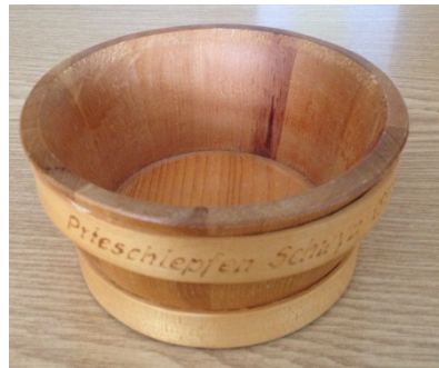
Holzmuttli (Lagergefäss für Milch)