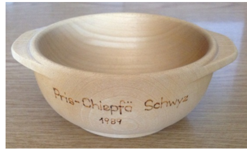
Ohräbeckli (Milchbeckli mit zwei Griffen)