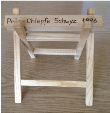
Sagbock (Gestell zum Sägen von Holz)