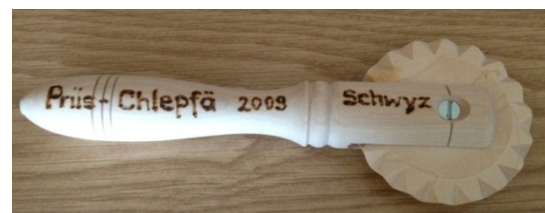
Chrapfäriesser (Schneidewerkzeug zum Zerteilen des Krapfenteiges)