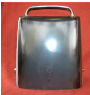
Abbildung 18: Bisse

Der Schwyzermeister erhält turnusgemäss entweder eine Bisse , eine Chlopfe oder eine Schelle mit gesticktem Riemen, die Junioren- und Schülersieger je eine Glocke (vielfach eine Schelle) als Wanderpreis, die von Firmen, Vereinen oder Privatpersonen gestiftet werden.