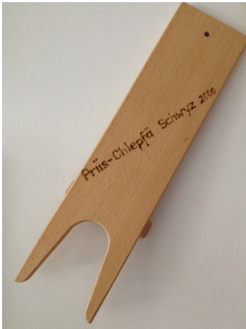
Stiefelchnächt (Halterung zum Abziehen der Stiefel)