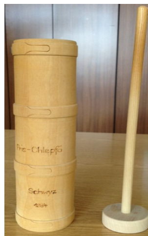
Nidläbläier (Gefäss zum Blähen von Rahm, einer andern Art zur Herstellung des festen Rahmes)