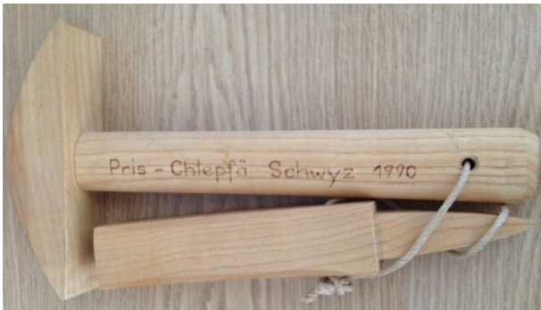
Dängälistock mit Dängälihammer (zum Glattschlagen des Sensenblattes)